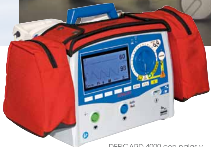
DEFIGARD 4000 con palas y bolsillos

El equipo puede retirarse fácilmente del soporte.