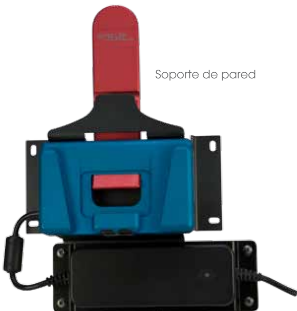
Soporte de pared